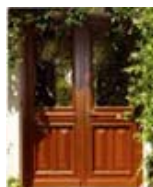
Portes d'entrée bois